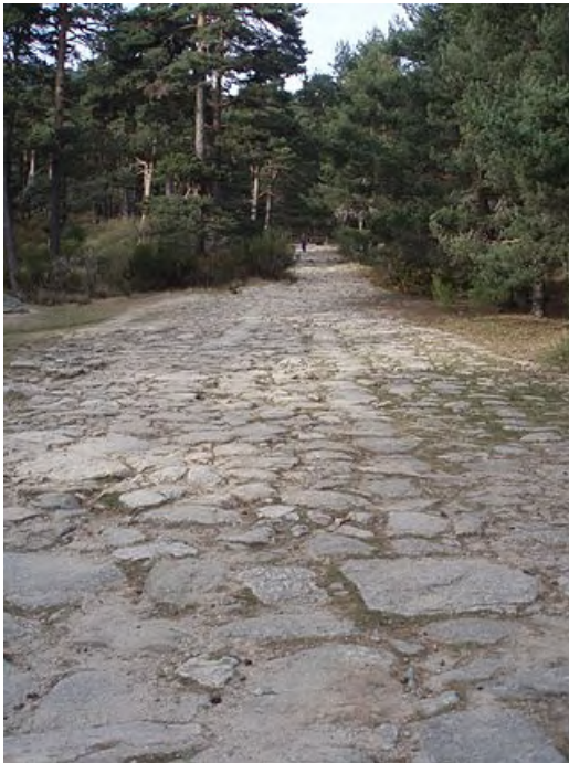
La Calzada Romana

La Calzada Romana de la Fuenfría son los restos de una calzada romana que unía Segovia con Collado Mediano. La calzada romana de los tiempos del emperador Vespasiano, aunque fue muy modificada por Felipe V en 1722, llegando incluso a rebajar en 5 metros la altura del puerto de entonces.