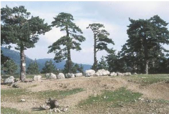
Puerto de la Fuenfría

El puerto de la Fuenfría es un paso de montaña que une las provincias de Madrid y Segovia, y se localiza a 1793 m entre Siete Picos y la Sierra de la Mujer Muerta. Aunque obviamente tuvo su importancia económica, actualmente sólo tiene uso lúdico, siendo un punto muy frecuentado por senderistas y montañeros.