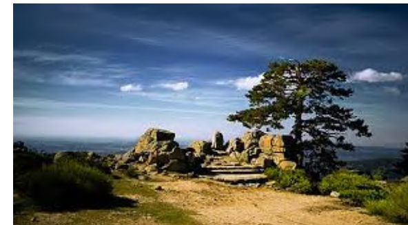
Los Miradores de la Fuenfría

Es necesario reservar plaza en la Secretaría antes del día 20 de Noviembre. El precio de la actividad es de 12 euros por persona para alumnos y